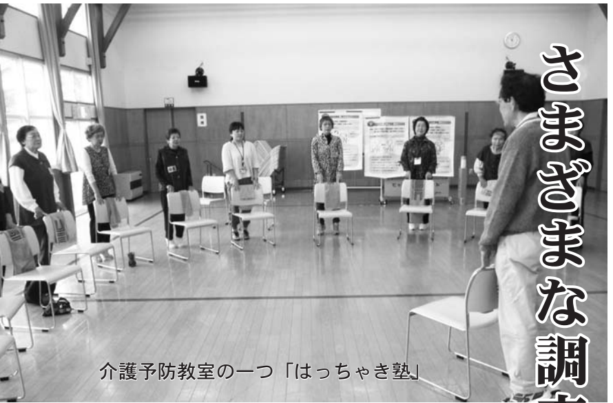
介護予防教室の一つ「はっちゃき塾」