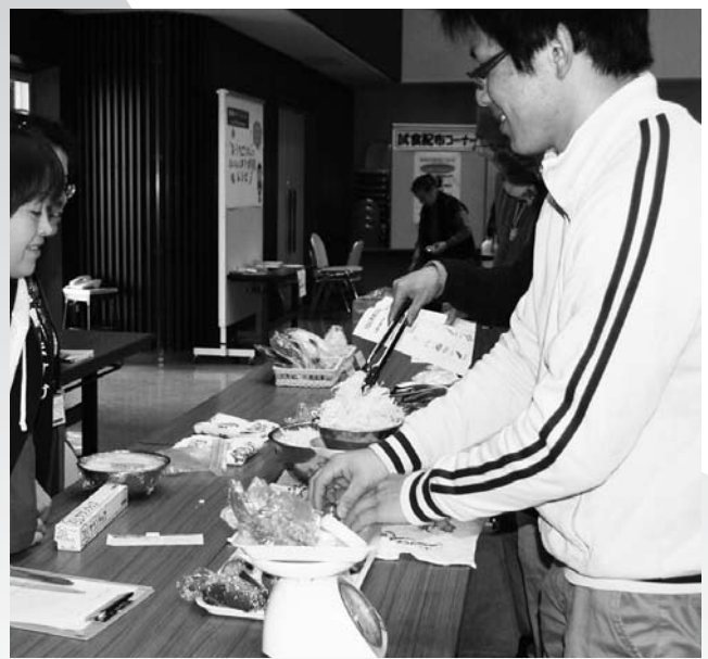
今年1月に開催した健康まつり

第3期の計画（平成24年度～26年度）が終了するため、現在、第4期計画（平成27年度～30年度）を策定中です。障がい福祉計画は、障がいのある方が、安心して地域生活、社会活動を営めるまちづくり・地域で自立して暮らすことのできる社会づくりに向けて、「障がい福祉サービスの見込量とサービス確保のための方策」を盛り込み、推進していきます。