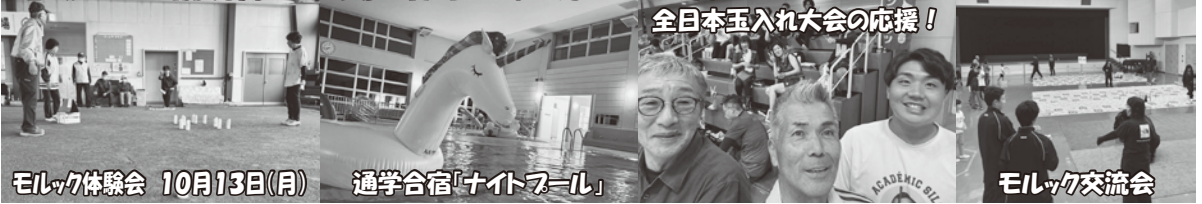
モルック体験会 10月13日(月)