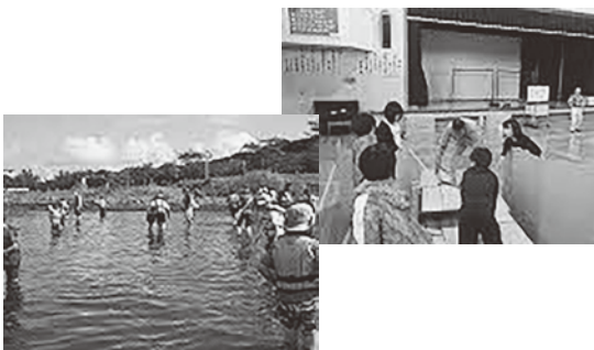
訓子府小学校 居武士小学校

9月24日、4年生は1日防災学校を行いました。子どもたちは、地震の際の避難所での生活や防災への心構えについて実際の写真を見るなどしながら学びました。段ボールベッドづくりでは、率先して組立て、協力して完成させることができました。たいへん頼もしい姿で活動していました。