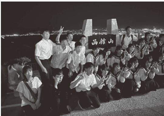
訓子府中学校 訓子府高校