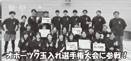
オホーツク玉入れ選手権大会に参戦！