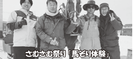
さむさむ祭り「馬どい体験」