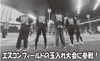
エスコフィールドの玉入れ大会に参戦！