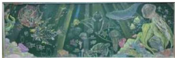
令和7年度 黒板アート作品

災害は、いつ起こるか分かりません。災害から自分の命や大切な人たちを守るために、「日頃からの備え」と「災害が発生したときの冷静な判断と素速い行動」ができるようになることが大切です。学校では、道德の授業の中で「生命の尊さ」について考えたり、避難訓練を実施したりしています。各ご家庭でも『防災の日』を機会として、避難時に持ち出す物、連絡方法、避難先などについて話し合いをもち、確認していただけると幸いです。