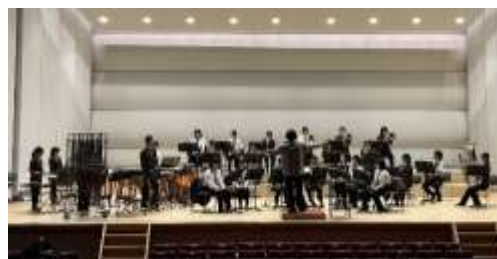
市民会館での練習風景