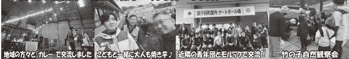
地域の方々と「カレー」で交流しました