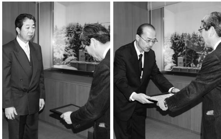
日本赤十字社北海道有功章の盾を受ける石川社長