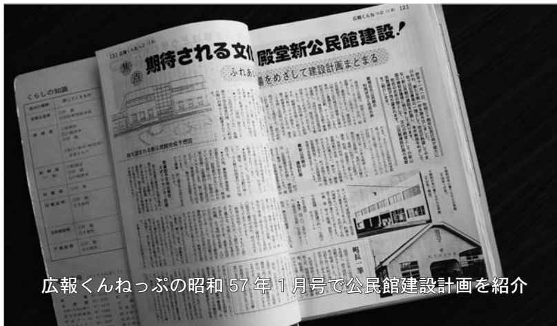
広報くねっぶの昭和 57 年 1 月号で公民館建設計画を紹介