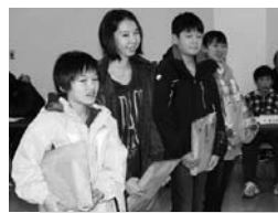
影(左)と受け入れ先の家族と記念撮影(下)