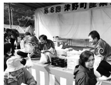
津野町でがんばってます