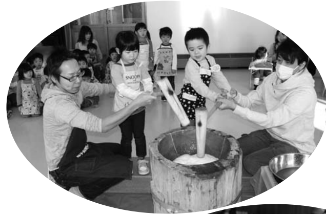
くんねっぷ保育園

父母や商工会青年部、先生などが手伝う中で、子どもたちは「ペタン、ペタン」と小さなきねを使ってもちつきをし、きなこもちや雑煮などにして、おいしそうに食べていました。