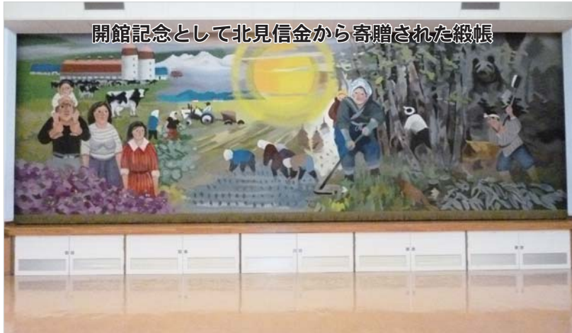
開館記念として北見信金から寄贈された緞帳