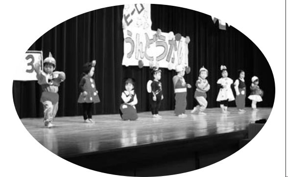
くんねっぷ保育園のゆうぎ会