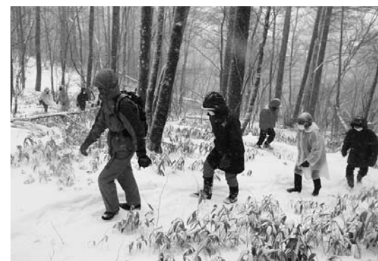
天狗高原の冬を体感する参加者

昼食は、地域食材をふんだんに 使った温かいセラピー定食。天狗荘 自慢の昼食に参加者から体が温ま ると大変好評を得ていました。 極寒の中のイベントでしたが天 狗高原の冬を体感でき、次回も参加 したいとの声がありました。