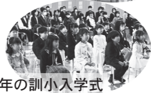
昨年の訓小入学式