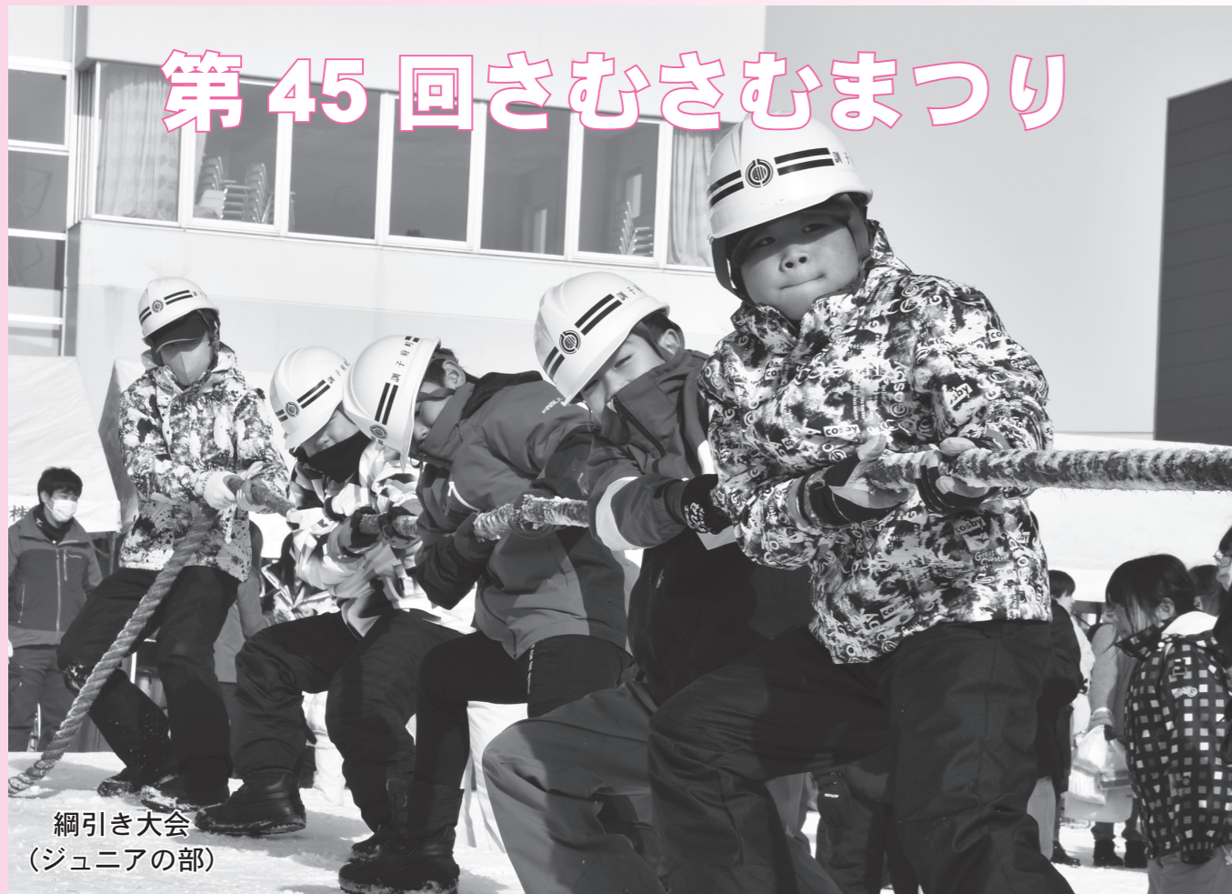
綱引き大会 (ジュニアの部)

冬の一大イベント「さむさむまつり」が2月4日に町公民館前特設会場で開催されました。この日は天候に恵まれ、会場には約1,000人が来場。青年4団体をはじめ、商工会女性部などの売店、太鼓演奏、キャラクターショー、綱引き大会、HIPHOPダンスなどの催しで子どもから大人まで大勢の方が楽しんでいました。また、同会場では「地場特産品開発物産展」が同時開催され、日の出めんや米太郎倶楽部、佐藤農場などたくさんの店が並び、会場に訪れた方が商品を買って求めていました。